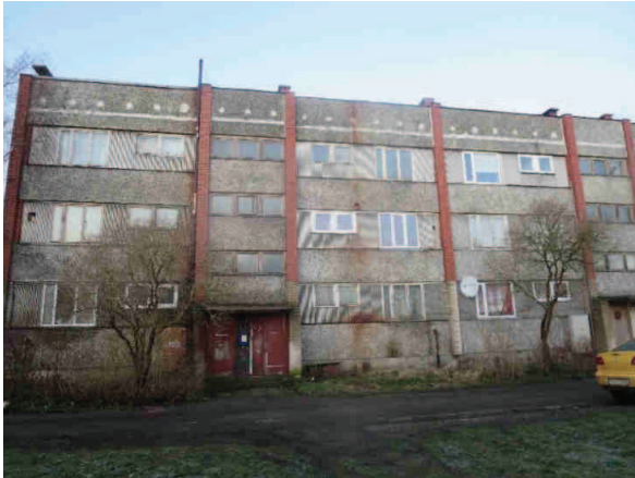
Dzīvojamās ēkas fasādes daļa