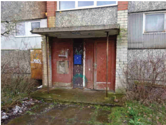
Dzīvokļu korpusa ieejas durvis