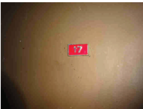
Dzīvokļa ieejas durvis