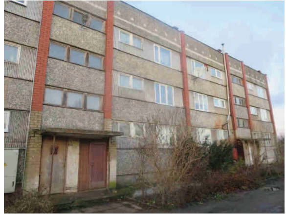
Dzīvojamās ēkas fasādes daļa